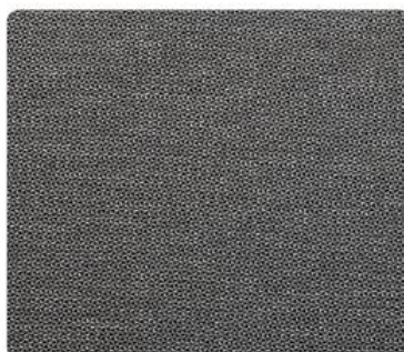
GL18 | Detroit