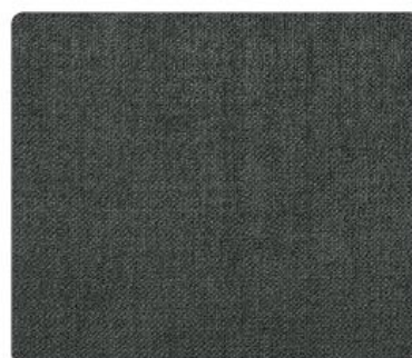
OL17 | Kawior