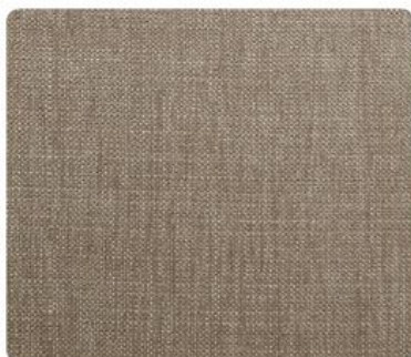
OL15 | Cappuccino