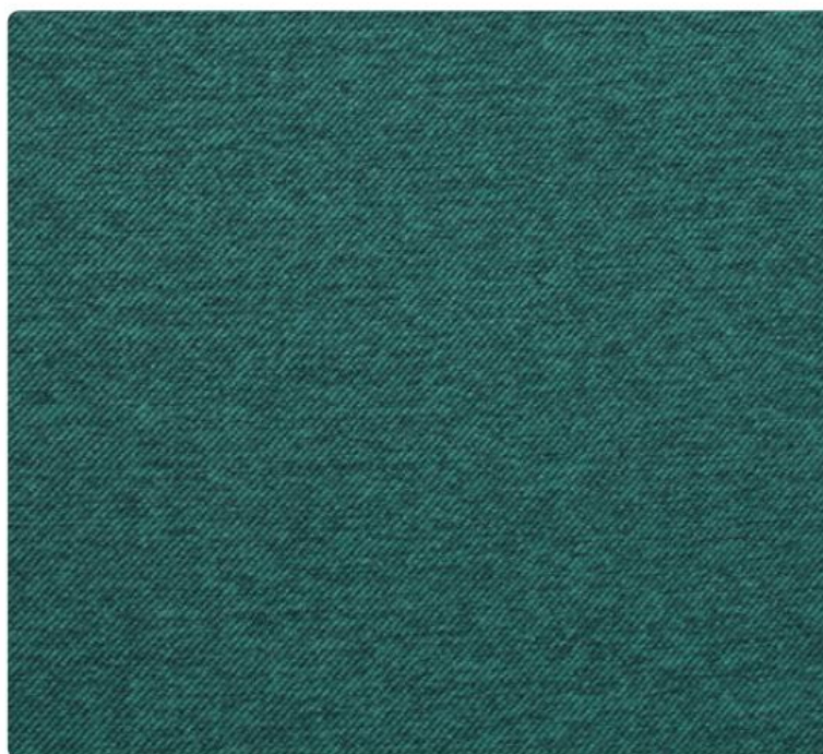
ME11 | Niebiański