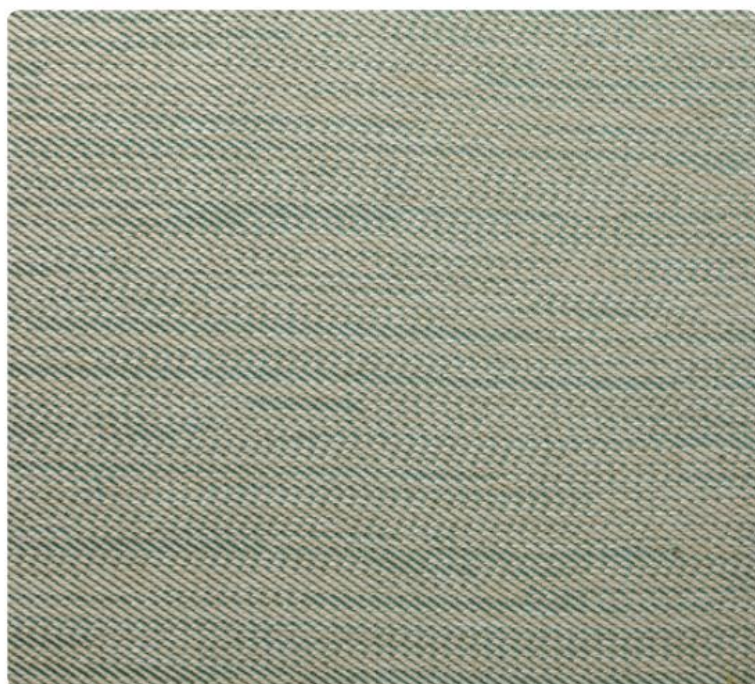
GL10 | Islandia