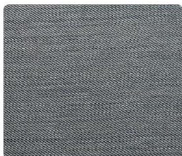
GL14 | Alaska