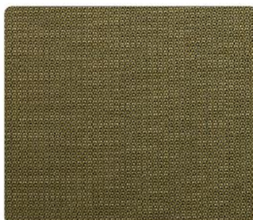
GL08 | Kair