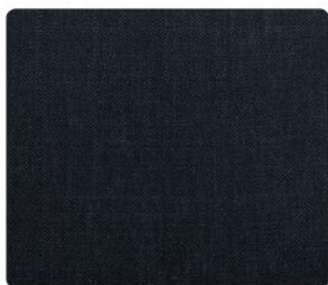
ME12 | Granat