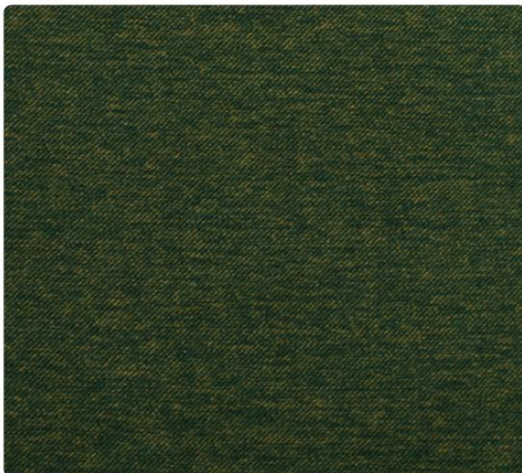
ME10 | Liściasta Zieleni