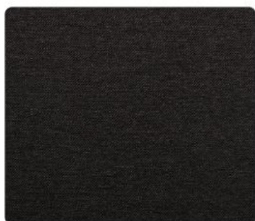
ME15 | Trufla