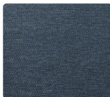
GL12 | Teksas