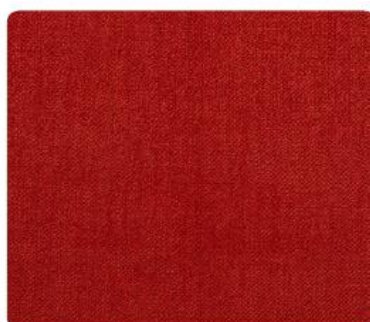
OL20 | Chili