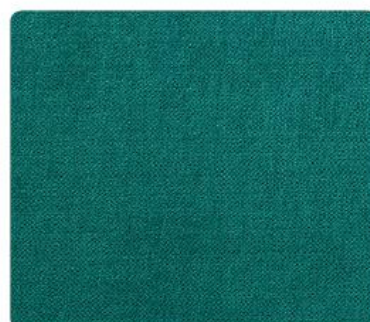
OL18 | Turkusowa Pianka