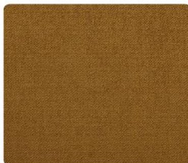
OL22 | Curry