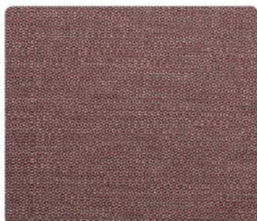
GL07 | Tasmania