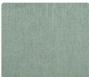
OL11 | Herbata Miętowa