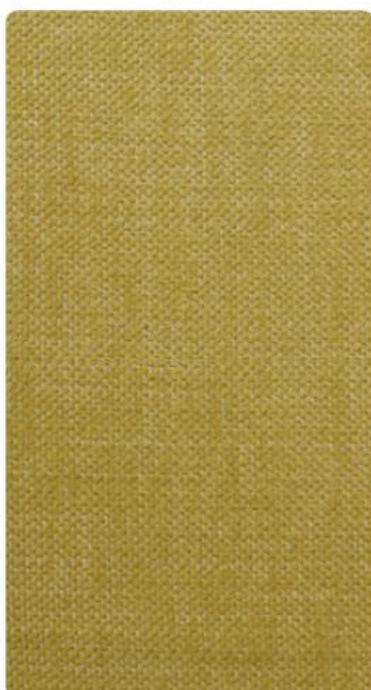
OL09 | Tarta Cytrynowa