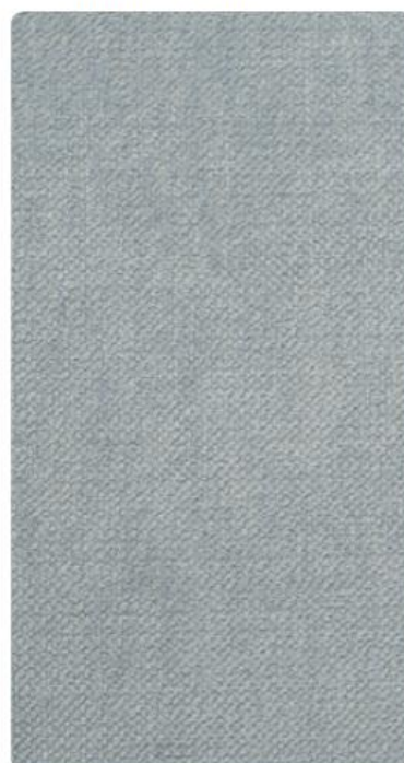
OL12 | Gorgonzola