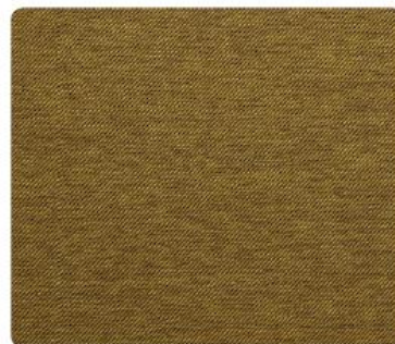
ME09 | Plaster Miodu