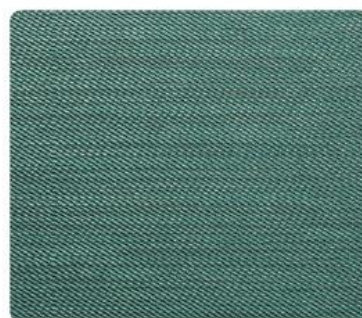
GL09 | Saint Tropez