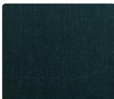
OL19 | Jeżyna