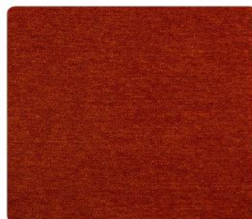
ME06 | Ceglasty