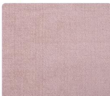
OL08 | Różowa Beza